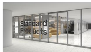
Standard Products by DAISO 店舗イメージ

「Standard Products」は、環境やライフスタイルの変化に伴う、良質で心地いい製品を長く使いたいというニーズの高まりにお応えし、普段の生活で使う日用品をちょっと楽しく、との思いで生まれた生活雑貨の新ブランドです。組み合わせて使える収納ボックスなどのリビング用品、食器などのテーブルウェア、バッグや服飾、雑貨など Standard Products のオリジナルアイテム約 1,300 品を取り揃える予定です。アイテムの価格帯の中心は、300 円とし、ダイソーが展開する「THREPPY」など 300 円ショップとは異なるアプローチにより、300 円ショップ市場のさらなる拡大を目指します。